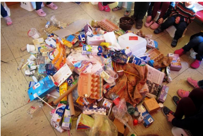
Beginn der Fastenzeit: Ein großer Müllberg in der Kita